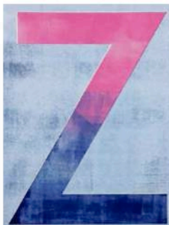
Zilla Leutenegger: Pink Z, 2015, Monotypie, Unikat, 140 x 100 cm, 8000 bis 10.000 Franken.