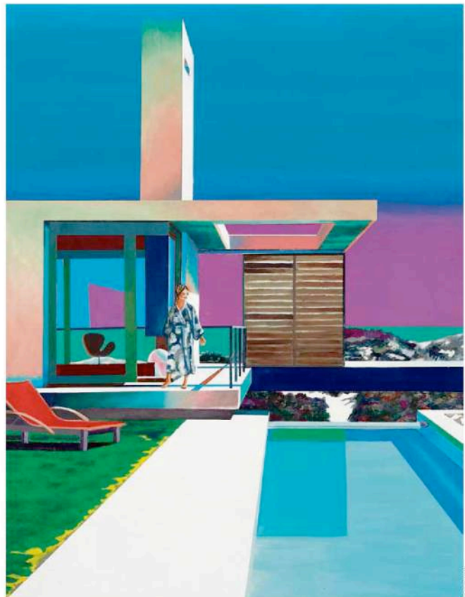
Leif Trenkler: «Yzerfontain am Morgen», 2014, Öl auf Holz, 130 x 98 cm, 13.600 Euro (Galerie Katz Contemporary).

Bereits zum achten Mal zeigt die Zürcher Galerie Peter Kilchmann die Schweizer Künstlerin Zilla Leutenegger in einer Einzelausstellung. Die neuen Arbeiten in «Moondiver» handeln vordergründig von dem Zusammenspiel von Farben und Formen. Die wiederkehrende Koexistenz von Videoinstallation, Skulptur und Zeichnung in den Arbeiten der 1968 geborenen Künstlerin steht auch in dieser Ausstellung im Zentrum. Sie greift zwei essenzielle Themen in Zilla Leuteneggers Arbeiten auf: Die Kombination von Farben und Formen und den «bewegten Strich im Raum». Diese werden von ihr mit einer gefühlten Leichtigkeit in Einklang gebracht. Es sind Momentaufnahmen unaufgeregter Alltagssituationen, die sie auf poetische Weise darstellt.