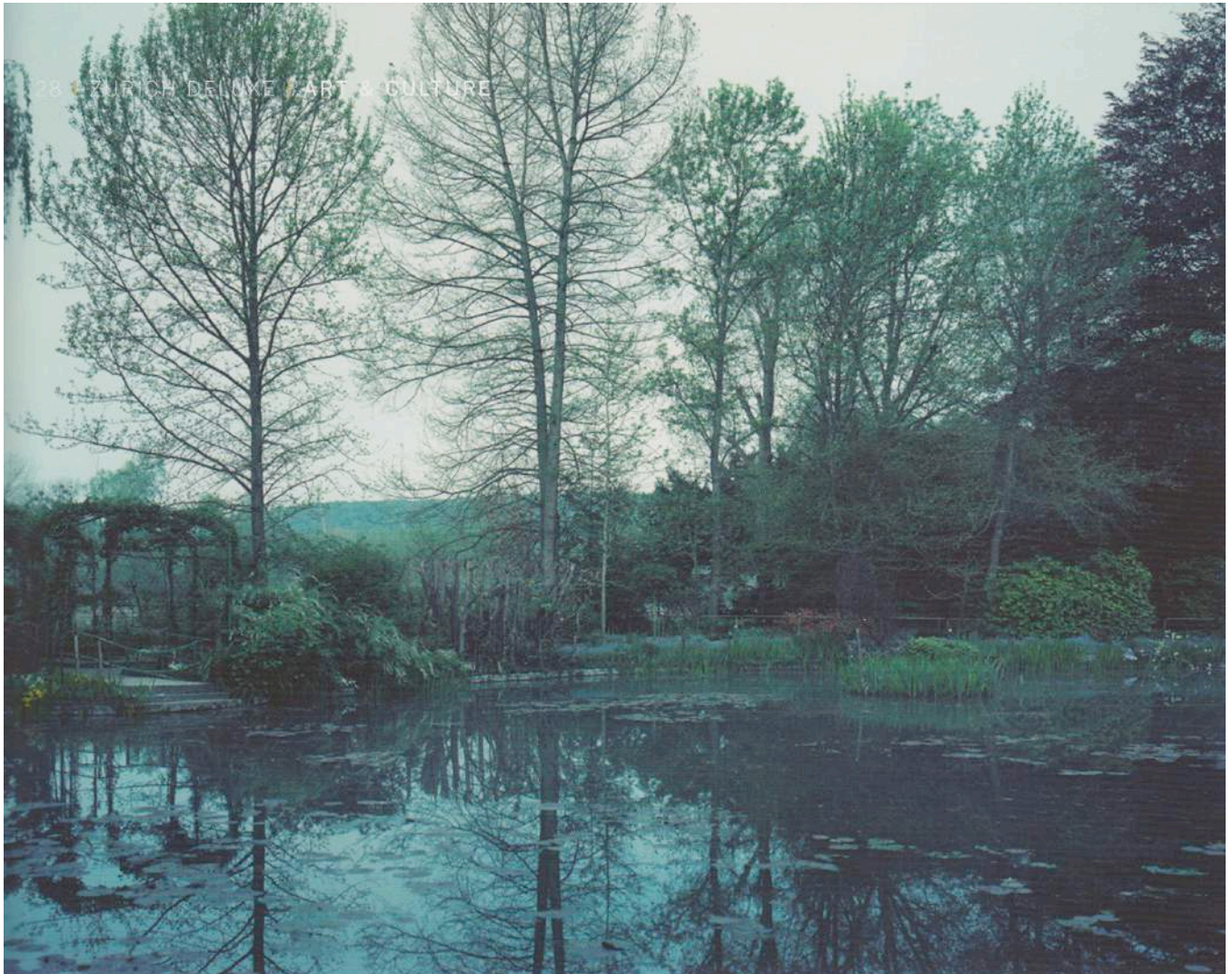
ELGER ESSER (*1967) "Giverny X", France 2010, direct print, copper plate, silver-coated, Unique, 50 x 75 cm (19 5/8 x 29 1/2 "), ELGER14846