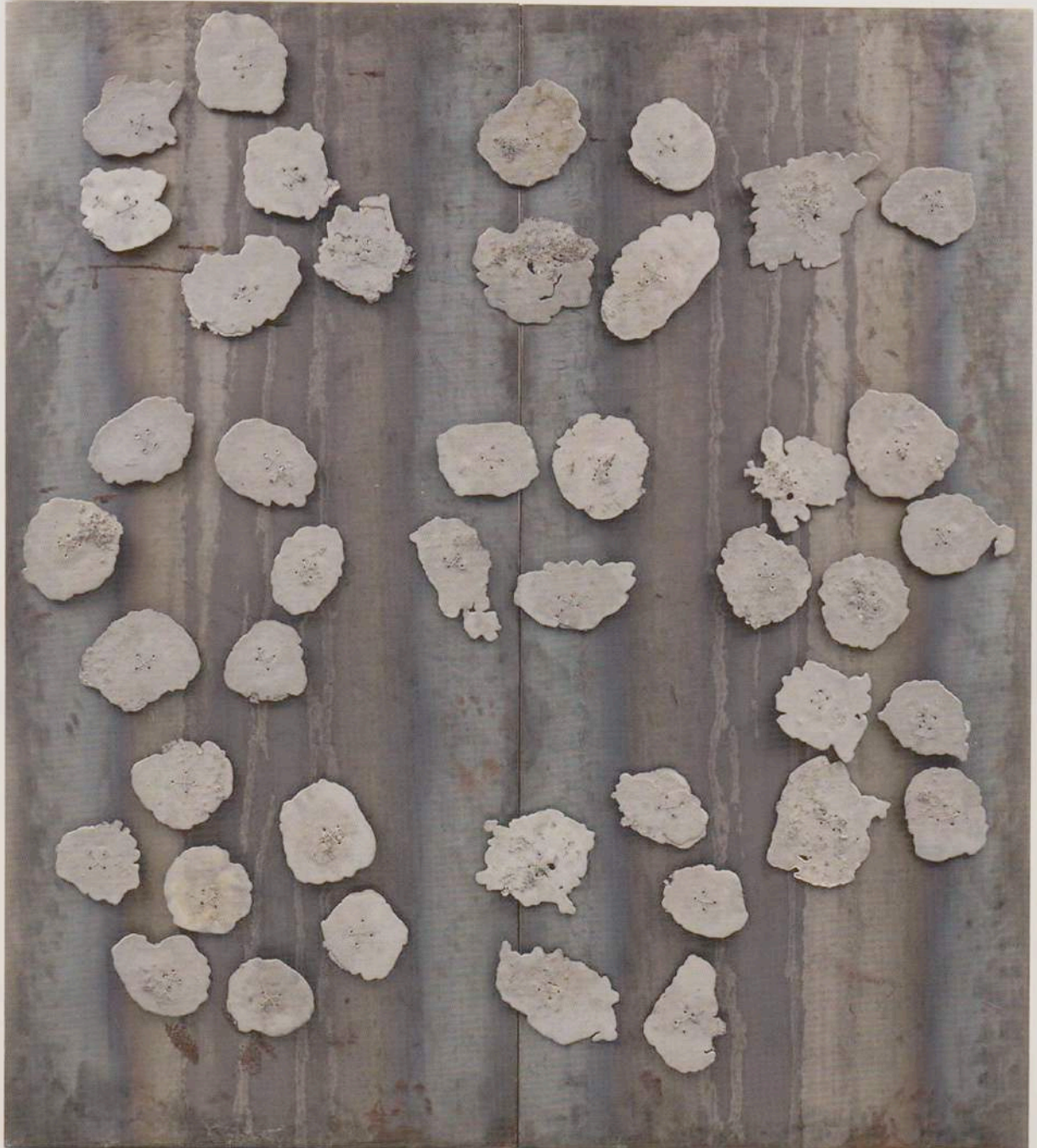
Jannis Kounellis (*1936), Untitled , 2008, Stahl, Blei, 200 x 180 x 6 cm